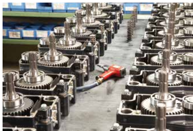
► Production des boîtiers de prises de force

Flexibilité et qualité maximale au niveau scientifique actuel de l'industrie agricole sont bien naturelles pour nous. Une longue expérience, des installations de production modernes et des collaborateurs qualifiés y sont la meilleure condition.