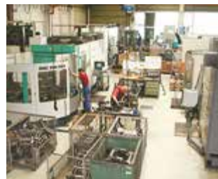
► Usinage à CNC