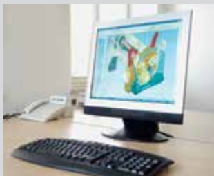
► Dessin assisté par ordinateur