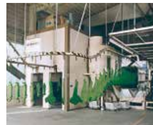
► Peinture par revêtement par poudre