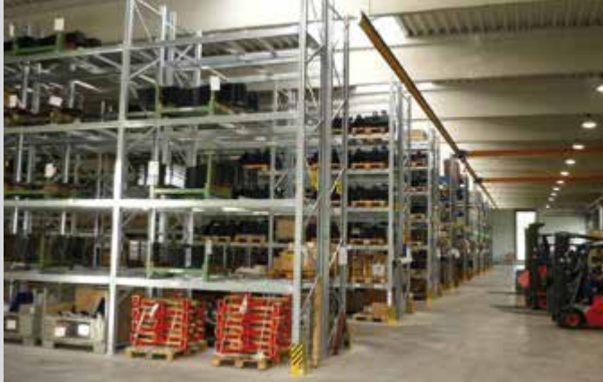
► Magasin et service d'expédition